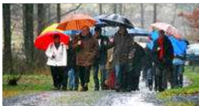
Nur gut beschirmt ließ sich der Poesiepfad am Samstag erwandern.

Rumbeck. (jst) Vollkommenes Unverständnis herrschte am Samstagnachmittag bei den rund 30 Teilnehmern der Eröffnungsbegehung der neuen Ausstellung "Wintergedichte" am Poesiepfad in Rumbeck.